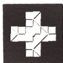
Das Bundesfeierabzeichen L'insigne du 1er Août 1989