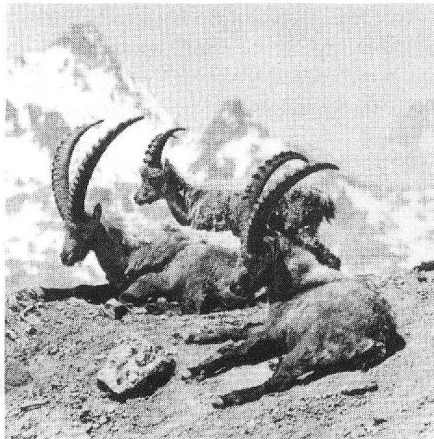
Die 1930 ausgesetzten Steinböcke bilden heute eine grosse Kolonie.

Am Piz Quattervals (dem «Berg der vier Täler», 3154 m ü.M.) leuchten die letzten Schneefelder unter dem tiefblauen Engadiner Sommerhimmel. Heiss ist es hier auf der exponierten Moränenhalde über der Waldgrenze. Vergeblich suchen geblendete Augen hinter Feldstechern das Gelände ab: Wo zum Kuckuck bleiben denn die Hirsche? Wir sind hier nicht im Zoo, sondern besuchen den Schweizerischen Nationalpark. Da