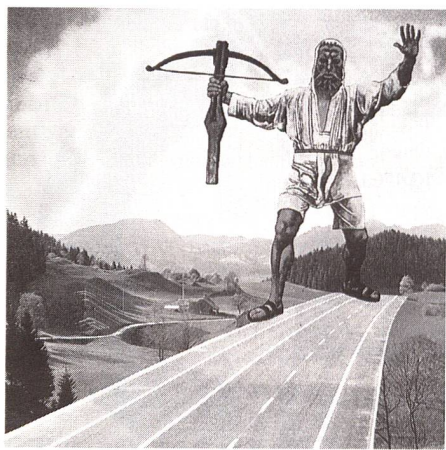
Wilhelm Tell im politischen Kampf («Stopp dem Beton»)...