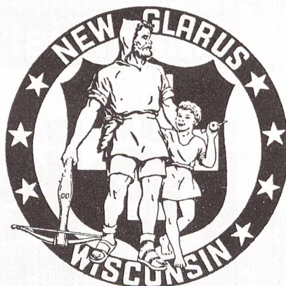
... auf Weltreise (Schweizersiedlung New Glarus in den USA)...