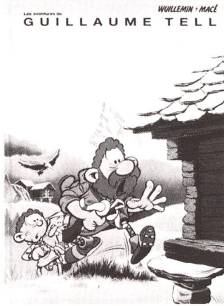
René Wuillemin, Gilbert Macé. Les aventures de Guillaume Tell. Editions des 3 pommes. Case postale 127, 1211 Genève 4.

ner Art ein wandelnder Anachronismus. Tell ist ein Durchschnittsschweizer mit Herzensregungen, er hat Kummer und Sorgen, kennt Ärger und Zorn, braucht Kraftausdrücke, erlebt Ehekrachs, zahlt Steuern und hat Freunde und Feinde.