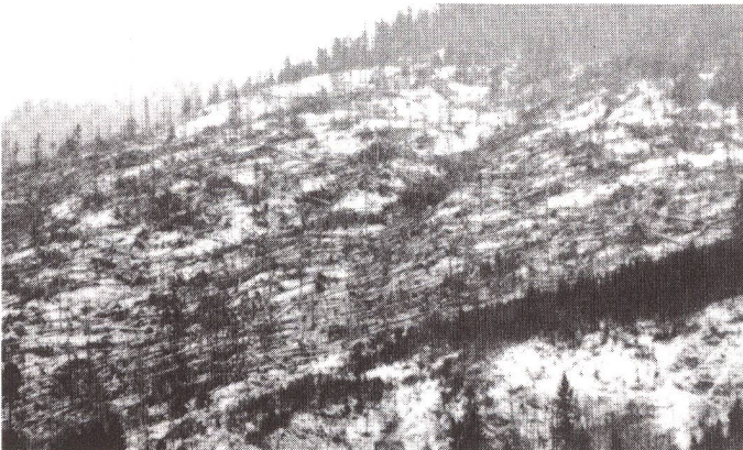
Sturmschäden im Kanton Glarus: Ganze Bannwälder liegen am Boden.