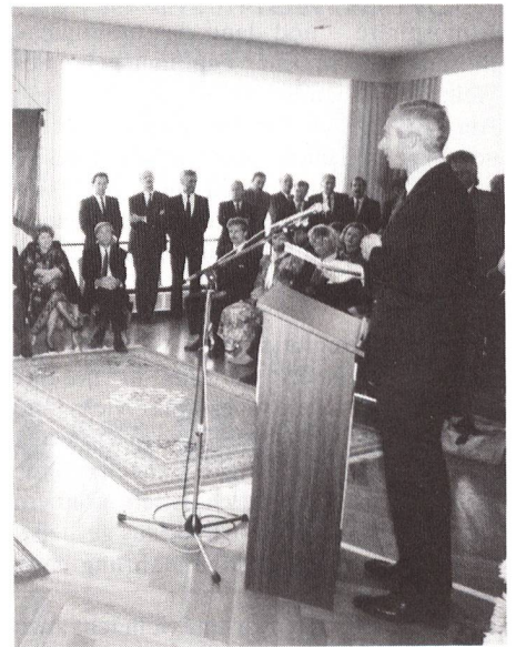
Ansprache Seiner Durchlaucht Fürst Hans-Adam II. beim Hauptsitz des Internationalen Komitees vom Roten Kreuz (IKRK)

velen, wo die Gäste aus Liechtenstein von einer Schweizer Delegation unter Bundespräsident Arnold Koller, Aussenminister René Felber und Bundeskanzler Walter Buser empfangen wurden. Eine grosse Anzahl Schaulustiger hatte sich beim Bahnhof Sevelen eingefunden, und bei prächtigem Wetter verliess der Sonderzug der SBB Sevelen in Richtung Kehrsatz bei Bern. Während der Fahrt in bequemen Salonwagen konnte ungezwungen diskutiert werden, und die mitreisende Presse wurde auf angenehme Art von Fürst Hans-Adam II. und Bundespräsident Arnold Koller überrascht, als diese von sich aus der Presse Gelegenheit für erste Fragen boten.