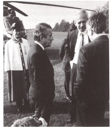
Bundespräsident Arnold Koller und Seine Durchlaucht Fürst Hans-Adam II. im Gespräch mit Bundesrat Kaspar Villiger (v.l.n.r.)