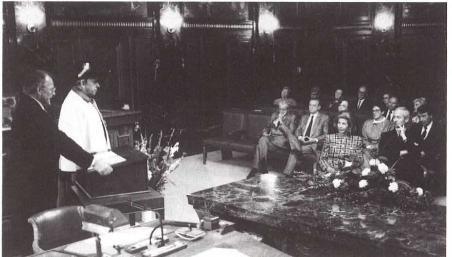
Die Gäste beim Besuch des Schweizerischen Bundesgerichtes. Begrüssung durch Bundesgerichtspräsident Rolf Raschein