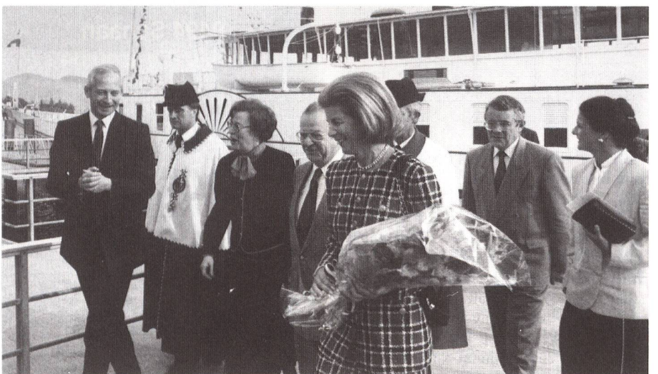
Der Präsident des Internationalen Komitees vom Roten Kreuz, Cornelio Sommaruga, im Gespräch mit Seiner Durchlaucht Fürst Hans-Adam II. und Bundespräsident Arnold Koller (v.l.n.r.)