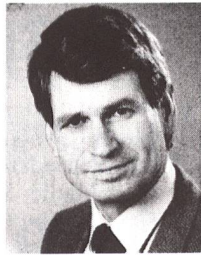
Minister Rolf Bodenmüller, Chef des Auslandschweizerdienstes, EDA

die Zustimmung erhält – das grösste vom Bund je in Angriff genommene Werk. Es verlangt viel Mut, Risiko – und Opferbereitschaft. Auch unser Land würde natürlich von diesem Vorhaben enorm profitieren: Die Verbindungen zu Europa würden kürzer und schneller, die Kontaktmöglichkeiten häufiger und intensiver. Damit könnten wir teilhaben an diesem einmaligen Prozess des europäischen Zueinanderrückens, dem wir uns auf keinen Fall entziehen können. Mit seiner NEAT-Botschaft – so meine ich – hat der Bundesrat viel Weitblick für die Zukunft Europas bewiesen – also genau das Gegenteil von dem, was man ihm zuweilen vorwirft. Es liegt nun am Ständerat, am Nationalrat und vielleicht auch an den Stimmbürgern, die bösen Zungen, welche uns gerne helvetischen Egoismus und eine Igelmentalität vorwerfen, Lügen zu strafen.