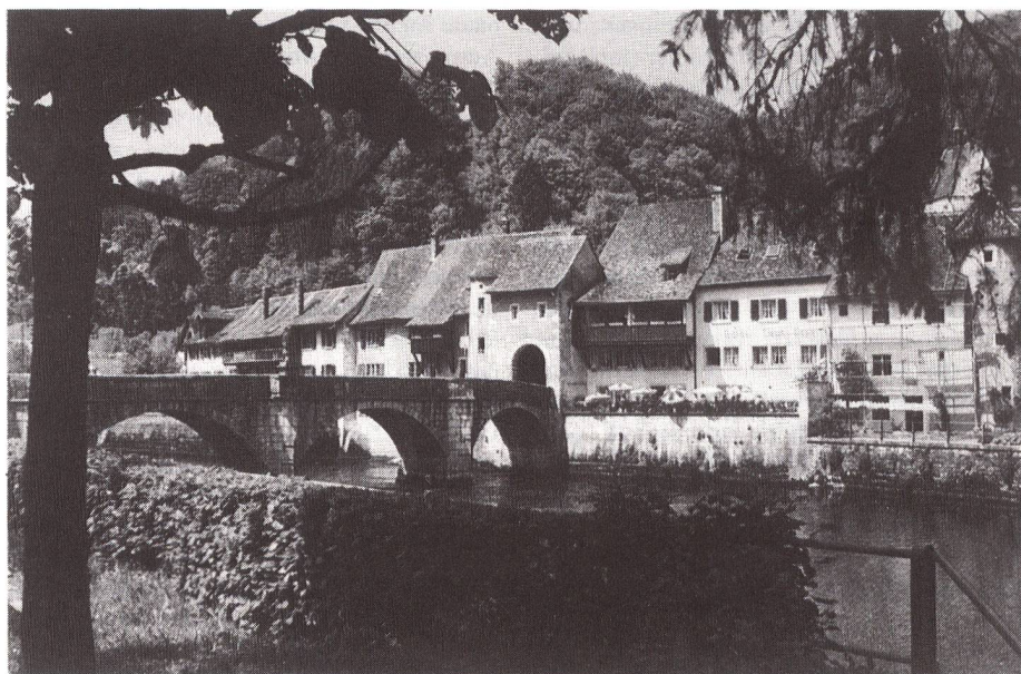
Konkret gibt es keinen Röstigraben; er ist lediglich ein treffendes Bild für die wachsenden Mentalitätsunterschiede zwischen Deutsch und Welsch. Unser Bild: St. Ursanne (Kt. Jura).

Die Schweiz sei «kein Vernunftsgebilde; sie lässt sich nur historisch definieren», sagt der Historiker Herbert Lüthy. Sie sei «das Ab-