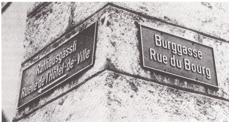
Die Zweisprachigkeit in der Stadt Biel/Bienne wirkt sich bis in die Verschiedenheit der Lehrpläne und Ferienregelungen aus.

ist «le patois» Umgangssprache. In letzter Zeit schenkt man dem «Patois» wieder mehr Aufmerksamkeit; der junge Kanton Jura erwähnt die Mundartförderung sogar in der Staatsverfassung.