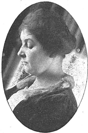
Miss Helen Pankhurst Die Schöpferin des Dalton-Planes

Sekte schafft, sondern weltweite und weltoffene Gemeinschaft — Fellowship wie der Weltbund für Erneuerung der Erziehung noch heute heisst — und niemanden ausschliesst, aber jeden verpflichtet.