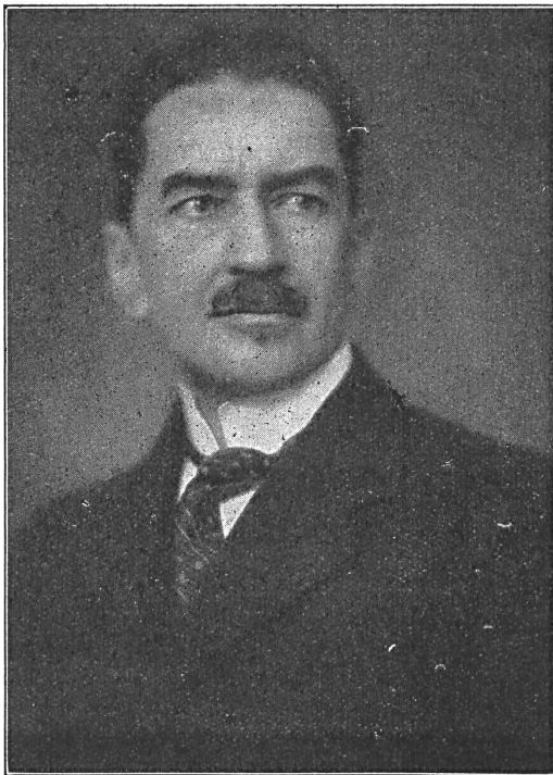
Prof. Dr. Hans von Euler-Chelpin

der Träger des diesjährigen Nobelpreises für Physik. Seine Forschungen über die Natur der Wellen beseitigten die scheinbar unüberbrückbaren Gegensätze der beiden bisherigen Licht-Theorien.