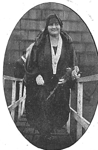
Dr. Maria Montessori