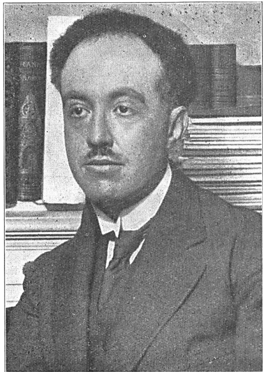
Herzog Louis Victor de Broglie

Professor der Biochemie an der Universität London, erhielt die Hälfte des diesjährigen Nobelpreises für Chemie für seine Forschungen über die Gärung der Zuckerarten.