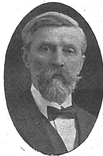
Dr. Ovide Decroly

Die kleinen Dinge und Vorkommnisse, die für den Zusammenklang zu einem Ganzen zu ihrer Zeit wichtiger wa-