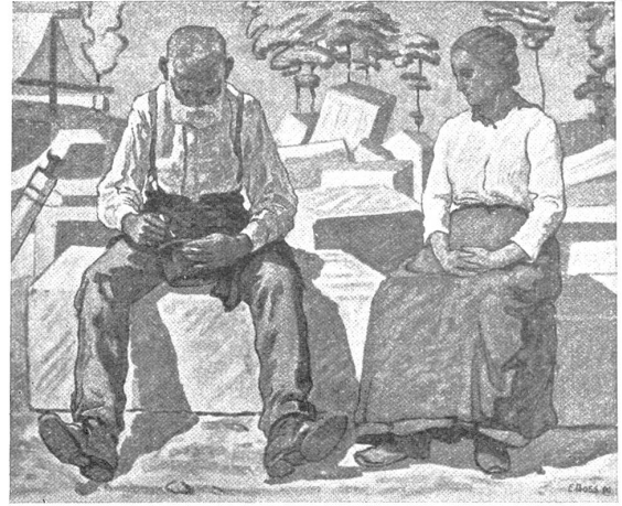
Eduard Boss: Steinhauers Mittagsmahl, Wolfsbergdruck

neben der andern. Sie helfen einander oder sie dämpfen einander. Das Blau der sonntäglich sauberen Bluse leuchtet aus der Wand heraus. Es wird blauer durch die Helligkeit der Wand. Das Rot der Handorgel sticht aus dem Blau der Bluse heraus und belebt das Gelbe des Blasbalges. Das Silberhaar des Alten bekommt durch den farbigen Hintergrund ein frohes Leuchten.