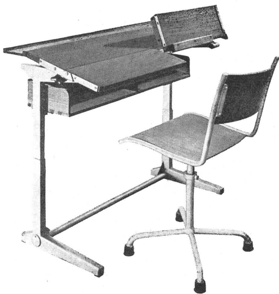
Freie Schulbestuhlung der Embru-Werke A.-G., Rüti-Zch.

steil anstieg, rückwärts etwas Halt bieten konnte. In den höchsten Klassen waren Pulte ohne verstellbare Platte mit Stühlen vorhanden, aber wer hätte sich damals über das richtige Verhältnis von Sitzhöhe und Arbeitspult Gedanken gemacht. Auch waren die Stuhl-