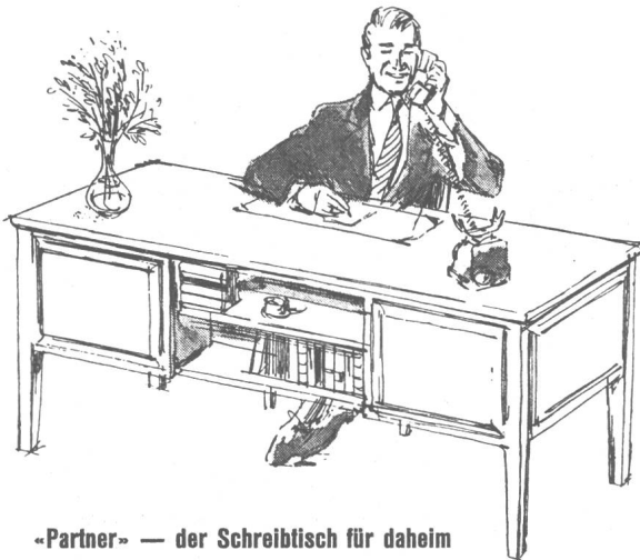
-Partner- — der Schreibtisch für daheim

Eines unserer kultivierten, schwerelosen Modelle für das private Studierzimmer. Seine spielend gleitenden Vollauszüge für Hängemappen nehmen Ihre Akten ebenso geordnet auf wie der raffinierteste Büroschreibtisch. Die Tönung des feinen Nussbaumholzes lässt sich vorhandenen Möbeln weitgehend angleichen. Viele weitere Modelle, klassisch oder ganz modern, dazu die passenden Büchergestelle und Schränke. Neuzeitliche Lehrerpulte für Schulzimmer. Freie Besichtigung in unserer grossen, permanenten Ausstellung an der Tödistrasse. Prospekt und Preisliste unverbindlich.