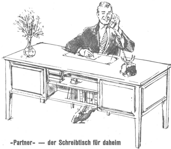
«Partner» — der Schreibtisch für daheim

Damen- Mode — Konfektion St. Leonhardsstr. 8-10 u. Marktplatz 22 Telefon (071) 22 27 01