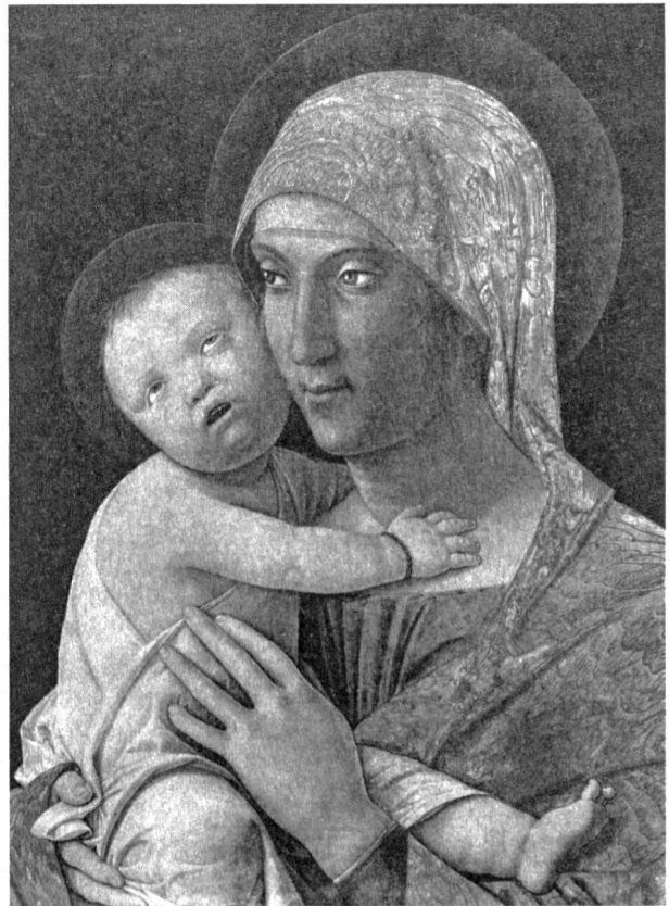
Andrea Mantegna (1431–1506): Madonna mit Kind

loiden nicht 49 oder 47, 50 oder 46 Chromosomen statt der damals noch als normal angenommenen 48 vorhanden seien. 1937 stellte Turpin seine Chromosomenaberrations-Hypothese auf. Fanconi vermutete 1939 eine Verminderung des Chromosomenbestandes bei Mongoloidie.