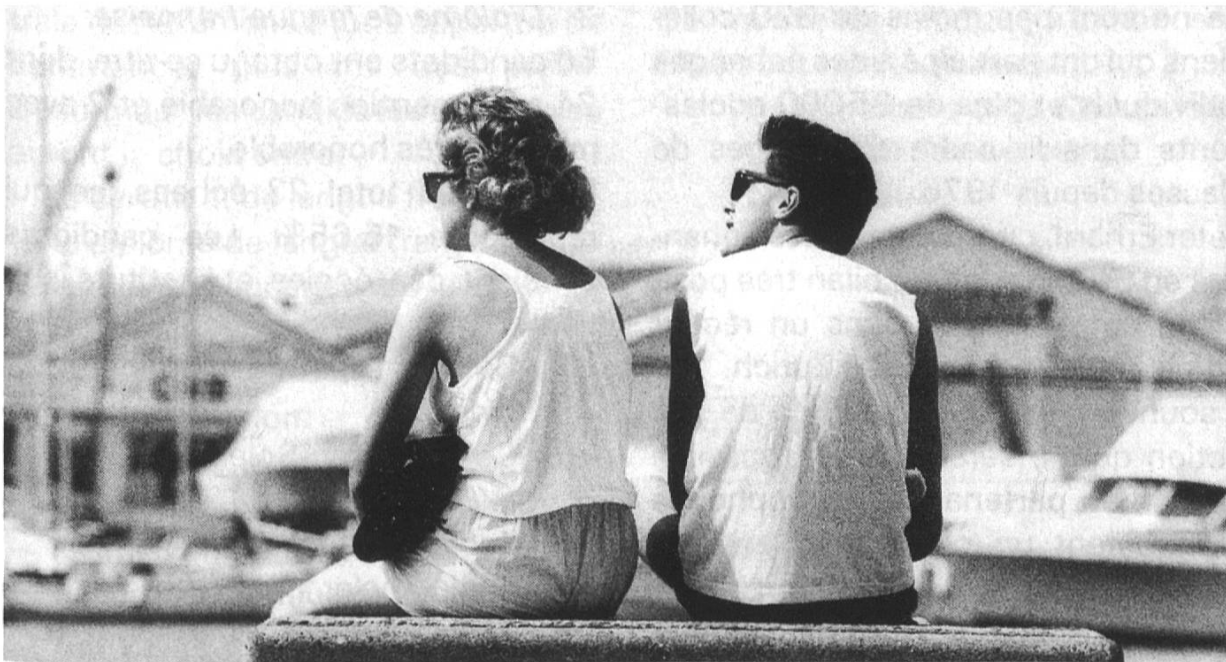
Jugendaustausch schafft direkte Kontakte

aktivieren, hänge nicht zuletzt von der Haltung der Deutschschweizer gegenüber den Romands ab. Von Bedeutung dürfte dabei sein, die Schwierigkeit der vielen Dialekte bei Kontakten mit anderssprachigen Schweizern – auch in der Schule – durch die Verwendung der deutschen Standardsprache zu überwinden. K.