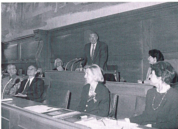
Bundespräsident Jean-Pascal Delamuraz eröffnet das Lernfestival im Berner Rathaus.

Die Preise wurden in feierlichem Rahmen anlässlich der Eröffnung des Lernfestivals im Berner Rathaus übergeben. Diesem Anlass wohnten Persönlichkeiten aus Politik, Bildung, Kultur und Wirtschaft bei.