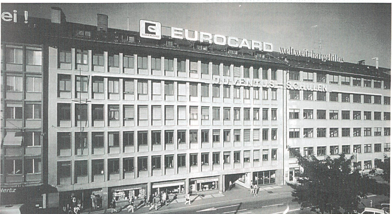
Juventus-Schulen: 5 Minuten vom HB Zürich entfernt.

Die Ingenieurschule Zürich HTL und die Berufsbegleitende HWV haben eine Vereinbarung abgeschlossen, die die Verschmelzung der beiden Schulen zur «Fachhochschule für Technik, Wirtschaft und Verwaltung Zürich» zum Ziele hat. Beide Schulen haben im November 1996 ihre Gesuche um Verleihung des Fachhochschulstatus bei den zuständigen Bundesbehörden eingereicht. Mit einem Entscheid des Bundesrates ist im Frühjahr 1998 zu rechnen.