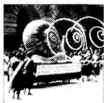
Eine Frau und ein Mann erleben unser Jahrhundert