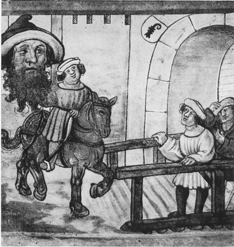
7. Die Luzerner holen Bruder Fritschi aus Basel zurück. 1508. Tafel 355 aus der Luzerner Bilderchronik von Diebold Schilling 1513.