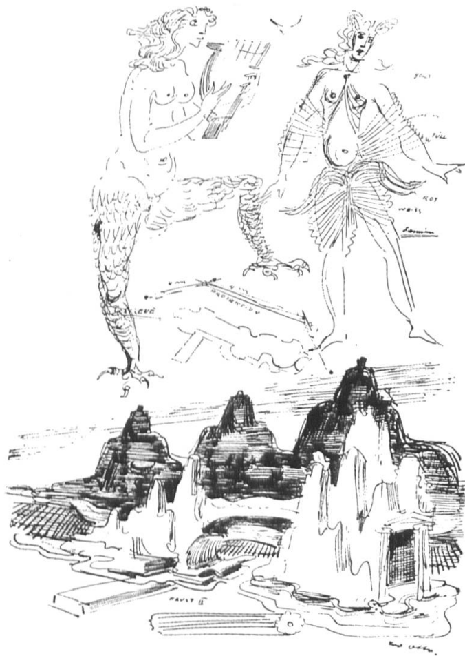
Bühnenbildskizze von Teo Otto zu Goethes «Faust» 2. Teil