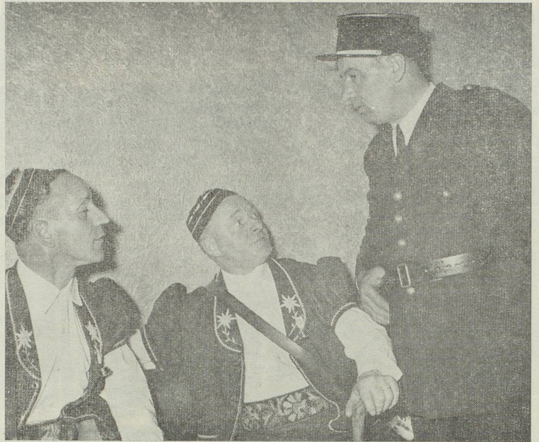
Deux armaillis gruériens écoutent, intéressés, les conseils d'un agent parisien.