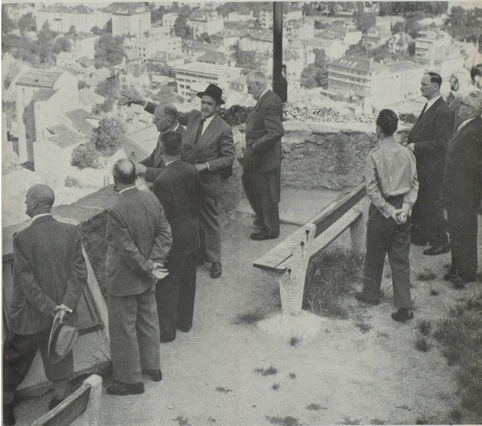
Le Conseil fédéral « in corpore » admire le paysage depuis Valère. De gauche à droite : MM. Etter, Hostenstein, Lepori, Streuli, Petitpierre, Feldmann et Chaudet.