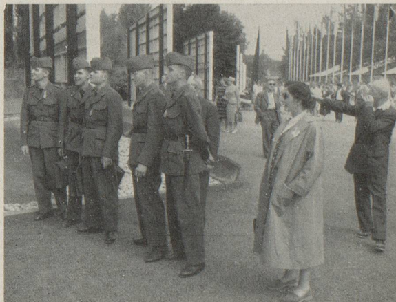
Quelques jeunes recrues, venues de l'étranger pour faire leur service au pays (photo en haut), et nos hôtes du « Home » (photo en bas) visitant la SAFFA 1958 lors de la Journée des Suisses à l'étranger à Baden - Zurich

Les cours, excursions, etc... n'ont lieu qu'en cas de participation suffisante; pour le reste, se référer aux conditions d'inscription figurant sur notre prospectus.