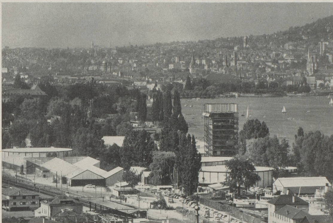
La SAFFA 1958. Vue générale avec le lac et la ville de Zurich