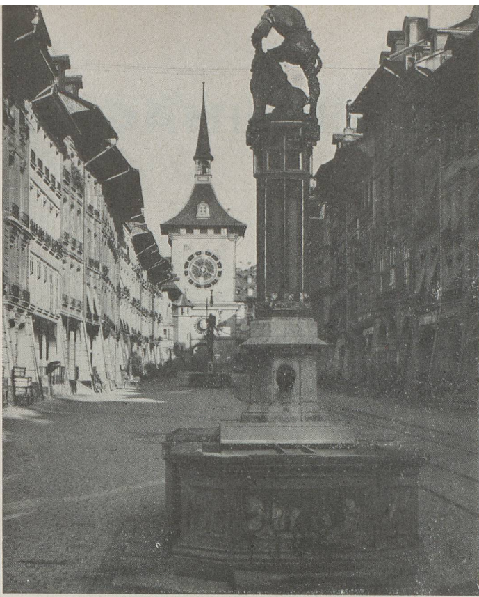
La Tour de l'Horloge

de Lausanne, qui se lancent dans une affaire que le Conseil fédéral appelle « une initiative hardie ». La convention prévoit une disposition permettant à la Société chargée de l'exploitation de prélever des droits de péage. Or, les experts de la Confédération prévoient un trafic animé pendant les mois d'été, mais un trafic modeste en hiver, les touristes faisant entièrement défaut.