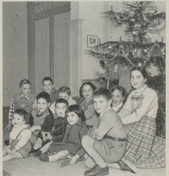
Radieux et heureux, ces enfants de Suisses de l'étranger fêtent au « Home » leur premier Noël dans leur patrie Glückliche Auslandsschweizer-Kinder erleben im « Home » ihre erste Weihnachtsfeier in der Heimat

« Home » pour Suisses de l'étranger... un pied-à-terre dans la patrie