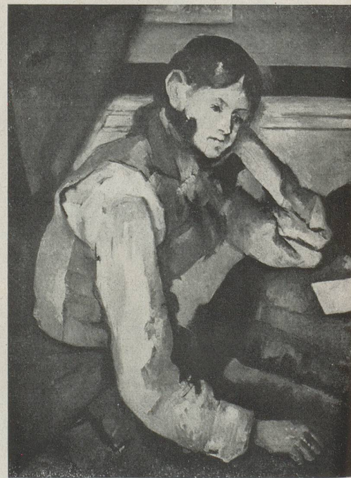
CEZANNE - Le garçon au gilet rouge Coll. Buhrlé, Zurich

André CHAMSON, de l'Académie Française, Conservateur en Chef du Petit Palais.