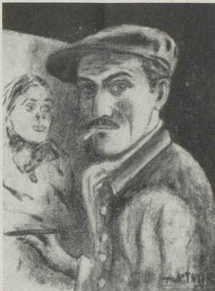
A.-R. THUR peint par lui-même

Notre compatriote, suivant sa vocation, a étudié à l'Académie des