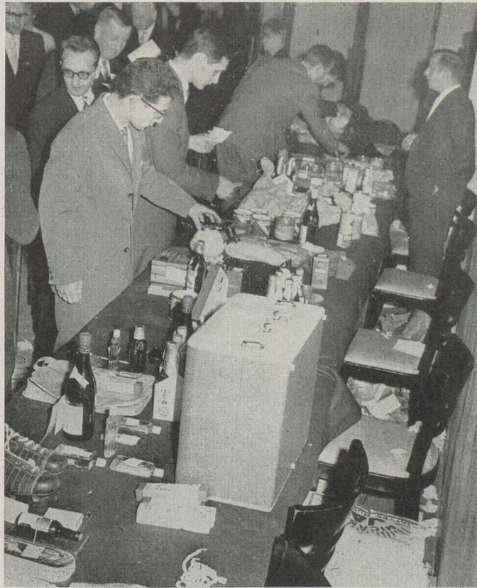
La tombola connut un grand succès. Il y a lieu de féliciter et de remercier les généreux donateurs qui rehaussèrent indirectement l'éclat de cette belle soirée.