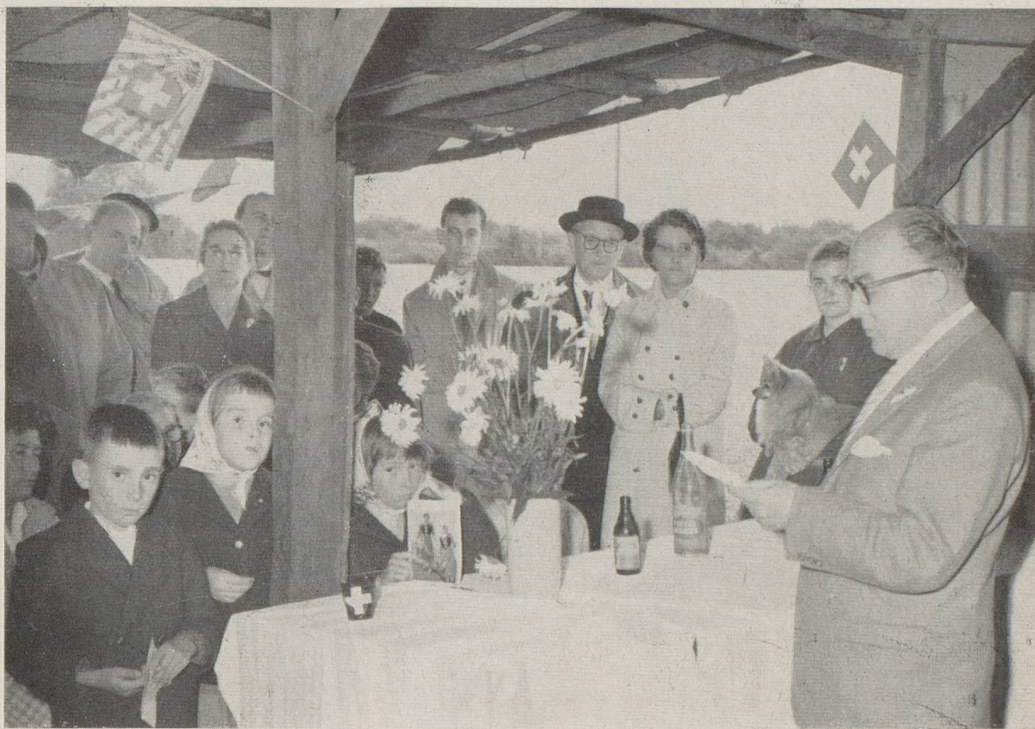
M. MAURER, Consul de Suisse, prononçant son allocution