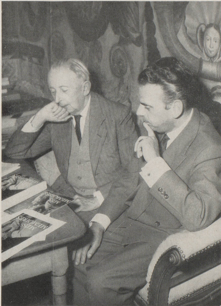
L'écrivain et son éditeur

On se tromperait fort en s'imaginant que ces trois volumes sont d'une lecture ardue ; au contraire, la vie ne cesse de les animer et de les rendre attrayants, d'un bout à l'autre. Ils offrent la plus grande