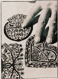
Quelques motifs finement ciselés qui auront leur place au centre d'un prochain tableau.

neur, sans doute, mais qui sont frémisants de vie et de fraîcheur, avec une pointe de naïveté qui vous fait penser au douanier Rousseau. Le musée du Vieux-Pays-d'Enhaut possède de une remarquable collection de découpages de J.-J. Hauswirth, tous dans un parfait état de conservation.