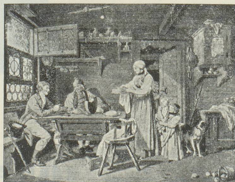
Sigm. Freudenberger, Bern 1745-1801

Le «Home» et les vacances à la campagne – en toute saison