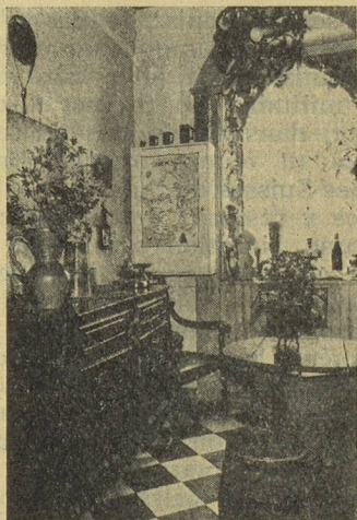
Bureau de réception.