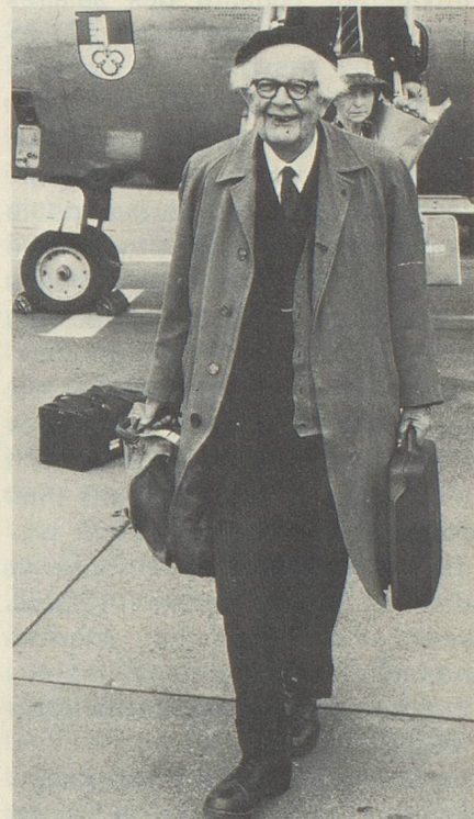
Le psychologue suisse Jean Piaget.

naie. Stabilisation du marché de la construction: 724819 oui, 154805 non. Sauvegarde de la monnaie: 808683 oui, 113314 non. Le pourcentage des votants, 25,8%, a été un des plus faibles jamais enregistrés.