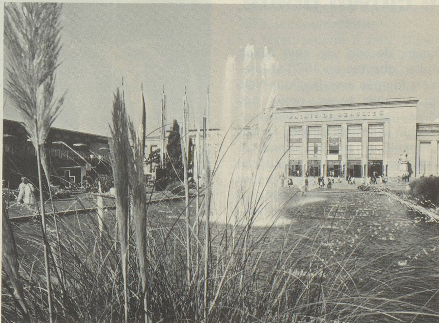
Les jardins du Comptoir suisse de Lausanne.

En football, dans le cadre des préliminaires pour la coupe du monde