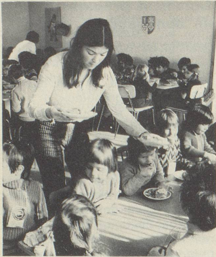
L'air de la montagne ouvre l'appétit et les repas avec les petits camarades sont toujours une partie de plaisir.