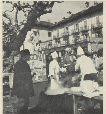
La fête du risotto, jadis célébrée par la population locale seulement, est devenue une attraction pour les touristes.