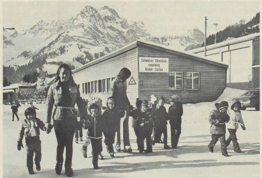
L'après-midi, les monitrices reconduisent les juniors à l'école de ski.

Office du tourisme. 4-8 ans ; jours ouvrables matinée et après-midi.