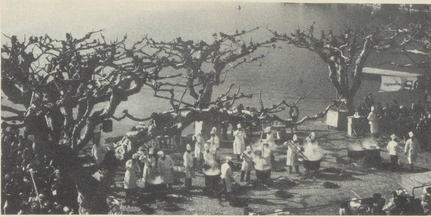
Suivant le nombre d'habitants du village, on utilise deux chaudrons ou plus pour préparer le risotto.