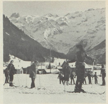
Dans chaque station, les écoles suisses de ski comportent des classes pour enfants. Les écoliers de 4 à 12 ans y apprennent les rudiments de l'art du ski.