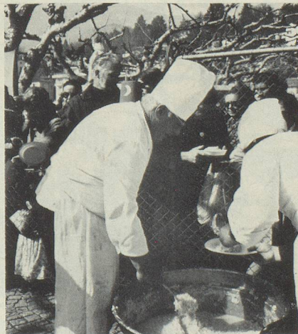
Même s'il est préparé pour des centaines d'estomacs affamés, le risotto reste une vraie spécialité gastronomique.

Dimanche 16 février 1975, Francini réunit tous ses fidèles amis et leur famille au Grand Hôtel du Pavillon, 36, rue de l'Echiquier à Paris X, pour un banquet suivi de bal. Inscriptions auprès de : Prospère César, 104, rue d'Avron - Tél. DID 05-43.