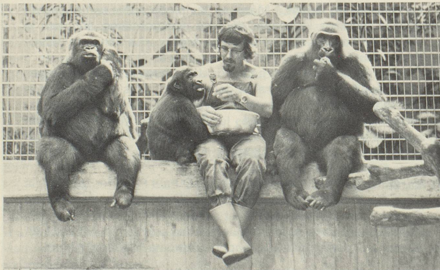
A gauche, maman Goma avec Tam-tam au cours de leur repas; Migger près du gardien M.W. Bayer; à droite, le gorille Käthy.

Cependant, rois et empereurs possédaient à leur cour des animaux sauvages. Tel était le cas notamment au Château de Schönbrunn, près de Vienne, et à Paris. Mais ce n'est que vers le milieu du siècle passé qu'on songea à les montrer aussi au peuple. A