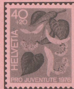
Linde Tilleul Tiglio