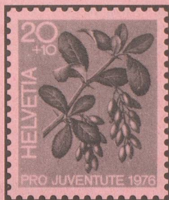
Berberitze Epine-vinette Crespino