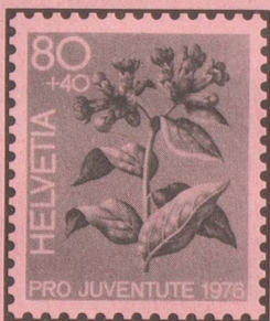
Lungenkraut Pulmonaire Polmonaria

Entwürfe 20+10, 80+40 c. Vreni Wyss-Fischer, Regensburg Dessins 40+20, 40+20 c. Hans Schwarzenbach, Bern Disegni