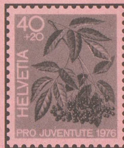
Schwarzer Holunder Sureau noir Sambuco