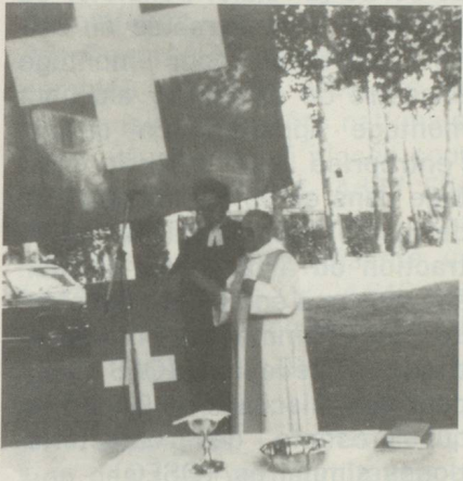
Célébration du culte oecuménique