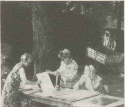
Le stand des Arts