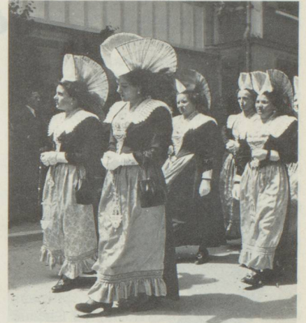
Appenzelloises en costumes

Le pays d'Appenzell est riche en traditions populaires restées bien vivantes, parmi lesquelles les «Silvesterkläuse» de l'arrière-pays. Cortèges à réminiscence païenne qui voit des personnes masquées, portant un immense chapeau comprenant des éléments de pur filigrane, qui font la quête pour les pauvres dans un vacarme assourdissant, car elles sont parées de