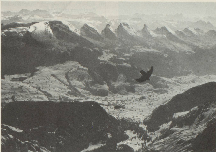
Depuis le Säntis, vue sur le Toggenburg et les Churfirten

La naissance du canton d'Appenzell présente, sous bien des aspects, des parallèles entre l'arri-