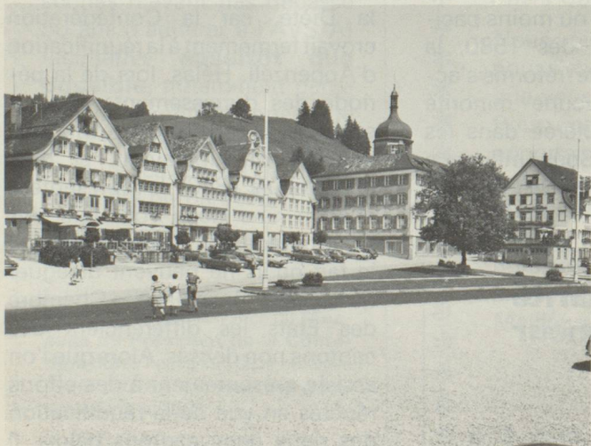
Maisons typiquement appenzelloises à Gais