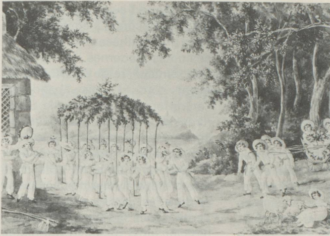
La Fête de 1833: danse des enfants du printemps.