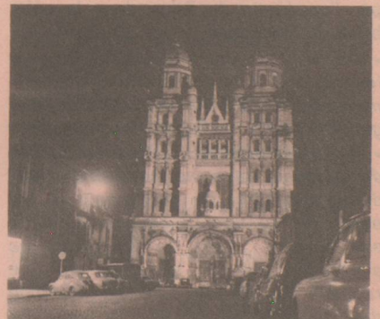
6, rue Rameau Tél. : 32-12-59