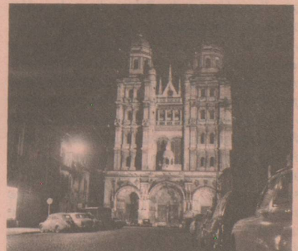
6, rue Rameau Tél. : 32-12-59