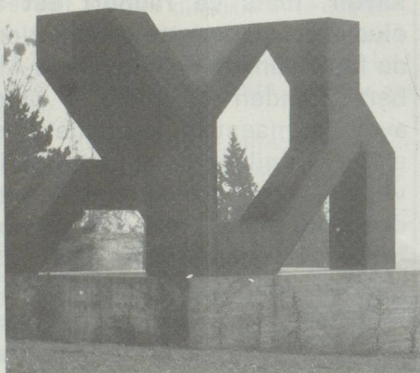
Gottfried Honegger « Hommage à Jacques Monod » Sculpture 1976, université Dijon.

Quelques sculptures de la même rigueur amènent une heureuse rupture de courbes dans cet ensemble où la droite est souveraine.