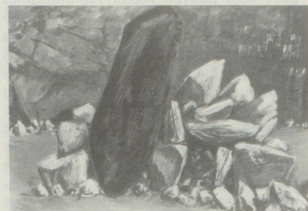
Moser « Stèle II, 1977 » Huile sur toile 100 × 150 cm.

Musée d'Art Moderne de la ville de Paris 11, avenue du Président-Wilson