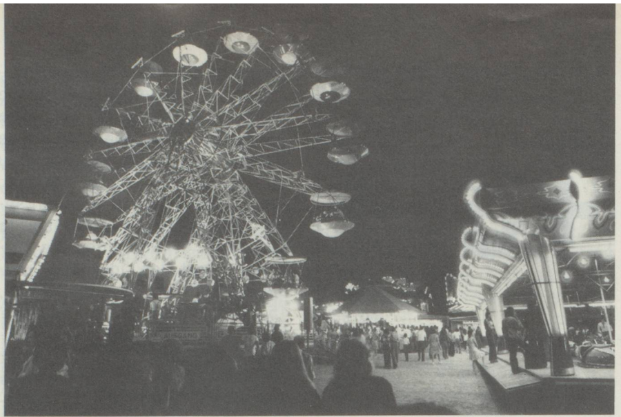
L'enchantement de la fête foraine retient tard dans la nuit la population zurichoise.

Durant ces quelques jours, des milliers de personnes se rendent au stand de l'Albisgüetli. Des tireurs chevronnés montrent aux jeunes amateurs la meilleure façon d'atteindre la cible. C'est à ce moment-là que commence le concours, qui se dispute avec le fusil d'assaut du pacifique soldat helvétique. Chaque participant a droit à cinq coups. Celui qui obtient