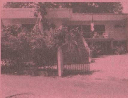
Ambassade de Suisse rue de l'Ecole de Santé B.P. 720 Donka KONACRY II Tél. : 613-87