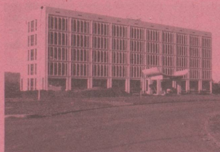
Ambassade de Suisse B.P. 597 KIGALI 21, boulevard de la Révolution Bâtiment de l'Agence Maritime Internationale (AMIRWANDA), 1 er étage, tél. : 5534