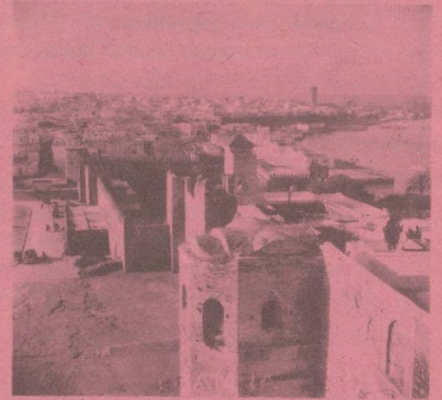
Rabat Ambassade de Suisse Boîte Postale 169 Square Condo-de-Satriano.