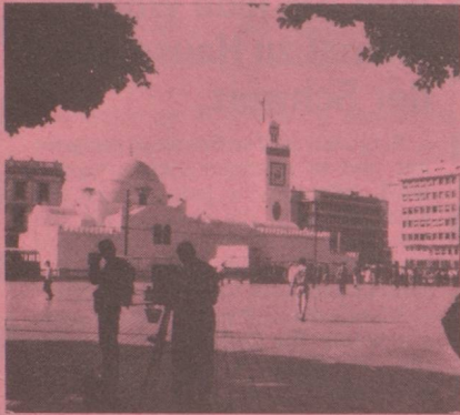
Ambassade , 27 Bld Zirout Youcef, de 9 h à 12 h du dimanche au jeudi, Boîte postale 482, Alger-Gare , Algérie.