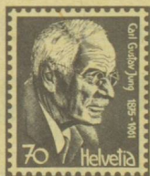
Carl Gustav Jung 1875-1961 Psychologe Psicologo