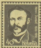
Henri Dunant 1828-1910 Philanthrop Philantrophe Filantropo