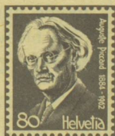
Auguste Piccard 1884-1962 Physiker Fisic