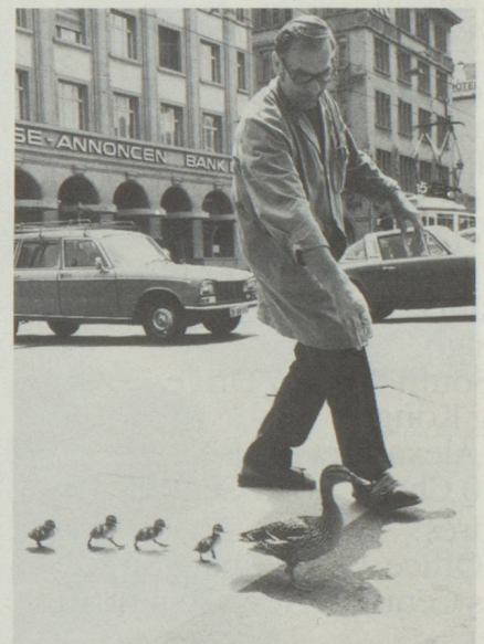
A tous nous souhaitons une «parfaite marche» en 1979 comme cette famille de canards du bord de la Limmat à Zurich.