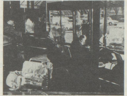
Le Terminus 1978 90 x 110 cm

Peintre bâlois établi dans la banlieue parisienne depuis de longues années, Ritter expose régulièrement dans la capitale française au Salon des Grands et Jeunes d'aujourd'hui et à la Galerie Liliane François. Fidèle à son esthétique attachée à l'Hyperréalisme, le peintre part de montages de docu-