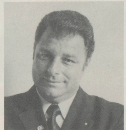
M. J.-P. Delamuraz conseiller national syndic de Lausanne