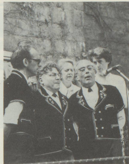
Le trio des jodleurs de l'Union Chorale suisse