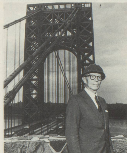
O. H. Ammann devant le «George Washington bridge»

Il représente l'émigré suisse typique. Il ajoute à l'esprit helvétique, fait de modestie et de soin, de sérieux et de simplicité, le besoin de croquer les espaces et les difficultés. Où le gigantisme et le défi technique fleurissent, le mélange est efficace. «Pour un demi-siècle d'inspiration exceptionnelle dans la conception esthétique et matérielle des ponts», Ammann reçut en